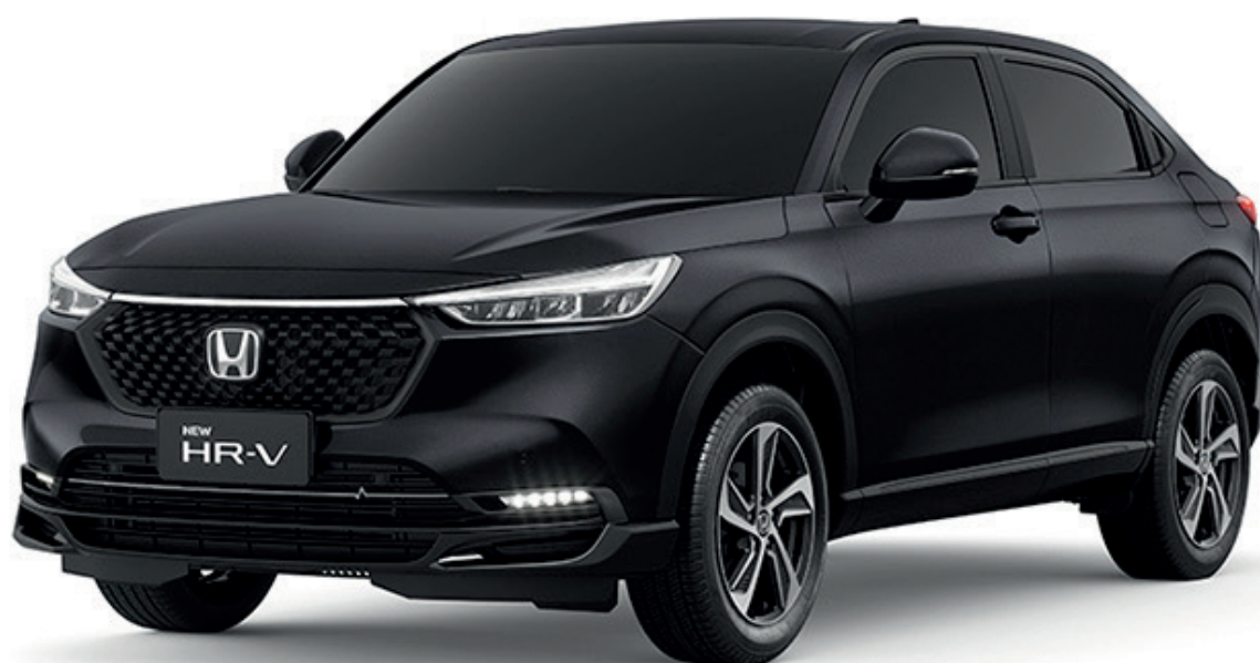
PRETO CRISTAL PEROLIZADO

*Verifique a disponibilidade de cor para a versão.