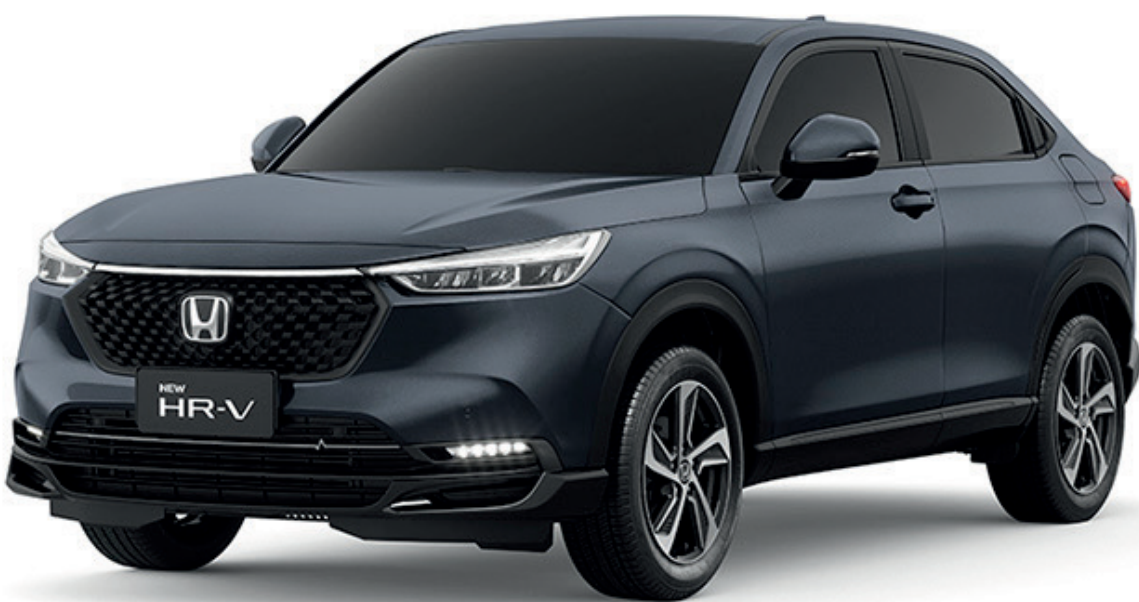
CINZA BASALTO METÁLICO

*Verifique a disponibilidade de cor para a versão.