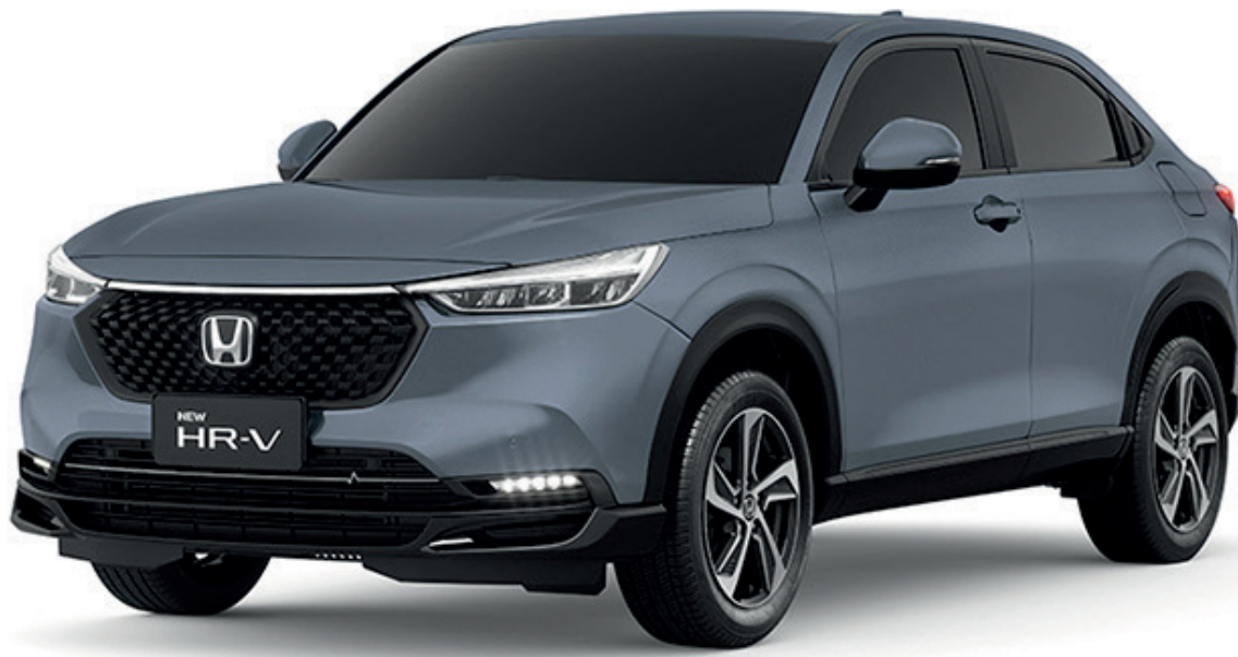
CINZA GRAFENO PEROLIZADO