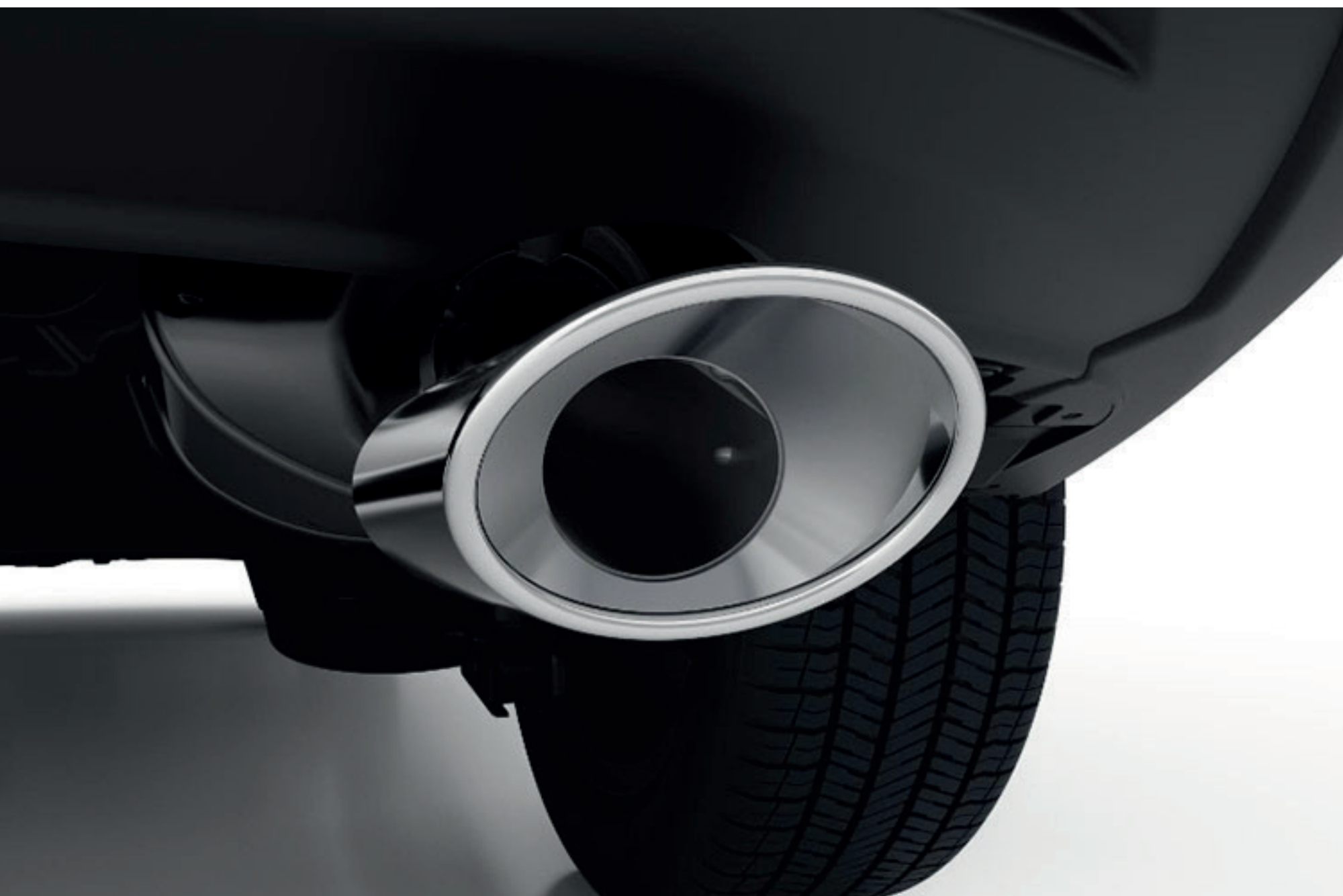
Ponteira de escapamento

Acessórios de proteção, personalização, utilidade e segurança desenvolvidos exclusivamente para você. Qualidade e confiabilidade para seu Honda com 3 anos de garantia.