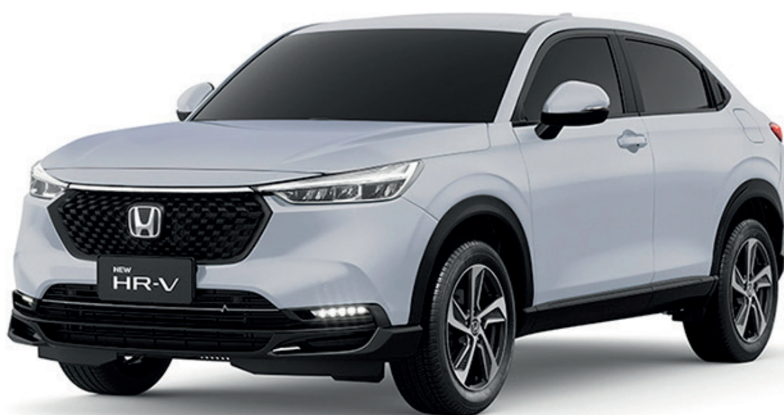
BRANCO TOPÁZIO PEROLIZADO