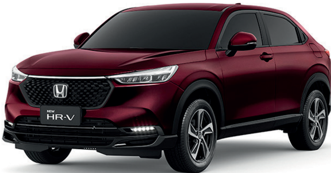
VERMELHO MERCÚRIO PEROLIZADO

*Verifique a disponibilidade de cor para a versão.